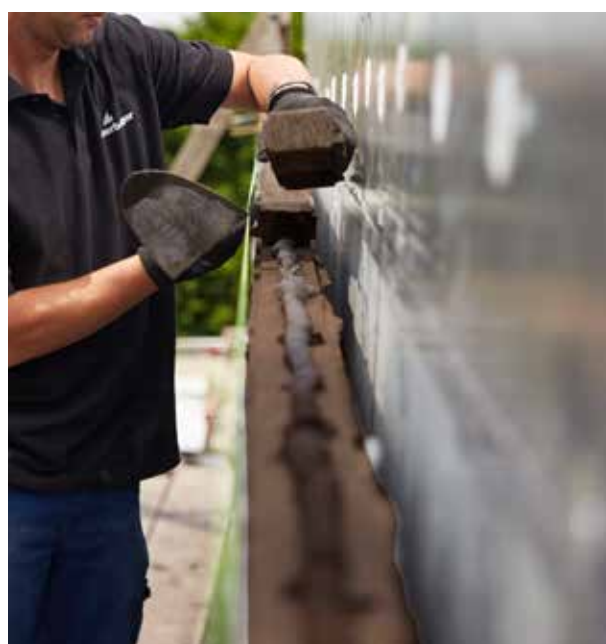
← Face rabotée