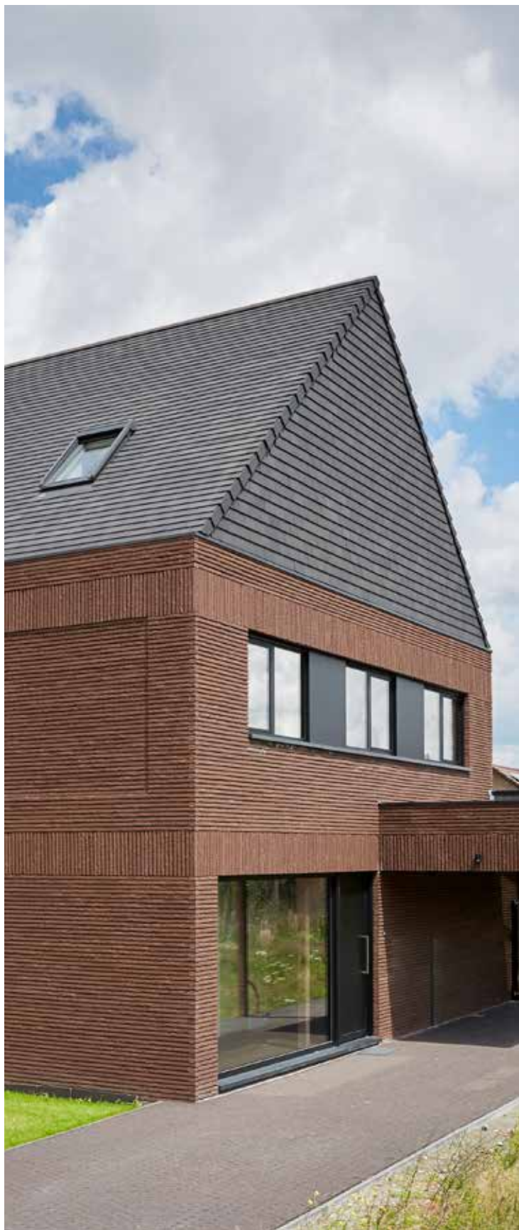
Façade : Terca Cassia Brun / Toit : Koramic Plato Bleu étouffé

“La brique de parement Cassia convenait à merveille pour créer la linéarité recherchée.”